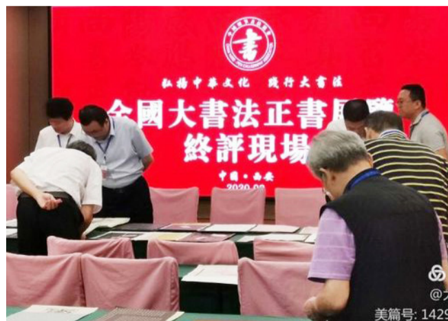
全国大书法正书作品展览终评工作评审现场